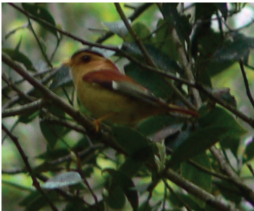
Figura 2. Macho de Bailarín Castaño Piprites pileata en un laurel layana Ocotea pulchella en el Proyectoado Parque Provincial Caa-Yarí (Kristina Cockle)