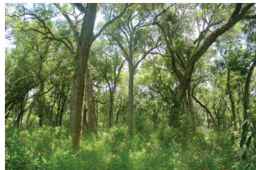
Figura 3. El único ambiente usado por el Bailarín Castaño Piprites pileata en Argentina es el bosque de laurel layana Ocotea pulchella sobre el arroyo Paraíso. A diferencia de la mayoría de la selva atlántica en Misiones, el bosque de laurel layana es relativamente bajo (15-20 m), con estrato medio y bajo despejado de vegetación